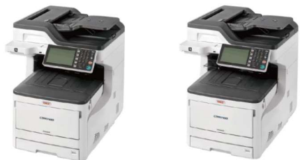
COREFIDO MC863dnw COREFIDO MC883dnw

LED技術だから実現できた確かな品質と充実のサービス。オフィスのニーズに応えつづけています。